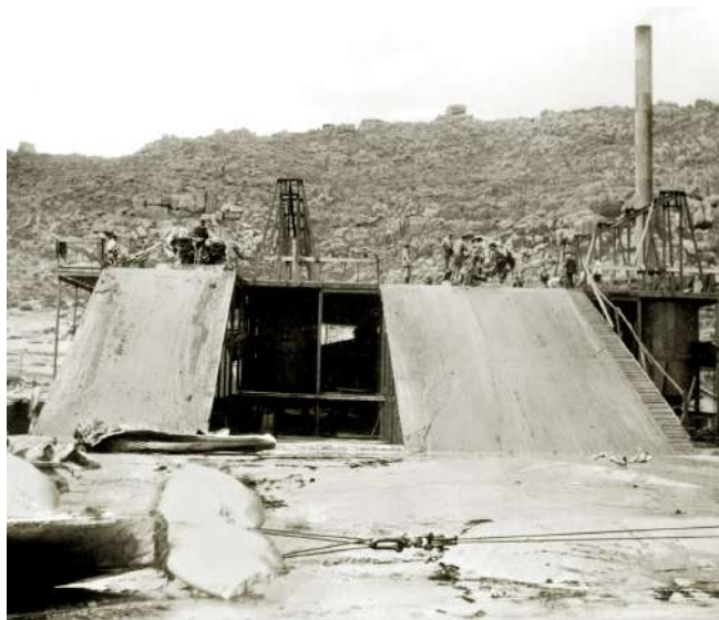
Ramplas para subir as baleas á plataforma de despezamento en 1925

Porén, as condicións de traballo eran duras, especialmente na década de 1920. O procesado das baleas era fisicamente moi esixente, había que soportar malos cheiros, as elevadas temperaturas das caldeiras, quendas de ata doce horas seguidas, e cobrábase só cando había traballo. A conxunción destes factores desembocou, en xullo de 1925, na decisión de setenta xornaleiros de abandonar a fábrica durante varios días. Esta acción foi a primeira folga de traballadores documentada na Costa da Morte.