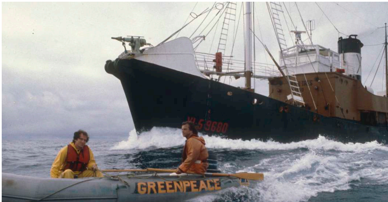
Activistas de Greenpeace impedindo ao IBSA III a caza dunha balea.

Fronte a estas accións de carácter pacífico, tamén se produciron dous atentados con bomba magnética contra baleeiros de IBSA nos anos 1978 e 1980. O último afundiú as embarcacións IBSA UN e IBSA DOUS, que estaban atracadas no porto de Marín, deixando á compañía tan só cun barco dispoñible para a captura de cetáceos. A acción foi posteriormente reivindicada por Paul Watson, un dos fundadores de Greenpeace, que fora