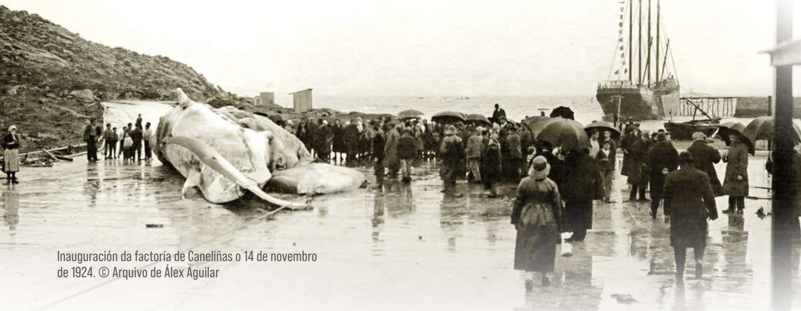
Inauguración da factoría de Caneliñas o 14 de novembro de 1924.