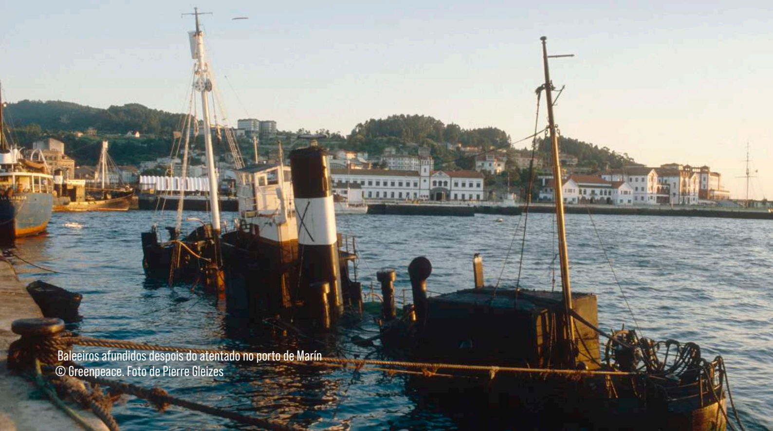
Baleeiros afundidos despois do atentado no porto de Marín

Este suceso limitou de maneira decisiva a capacidade de procesado da fábrica de Caneliñas, que pechou apenas cinco anos despois por mor da moratoria mundial na caza comercial de baleas imposta pola Comisión Baleeira Internacional .