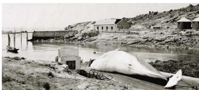
Balea na rampla de izado en 1925